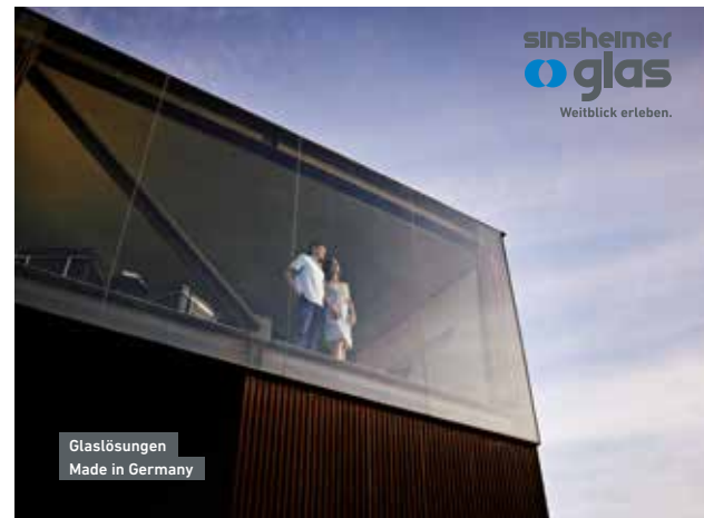
Sinsheimer Glas – Weitblick erleben.