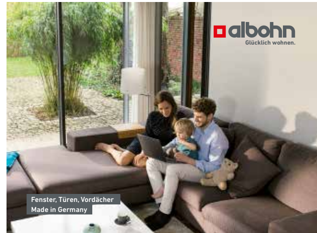
Albohn – Glücklich wohnen.