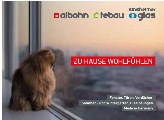
Unternehmensgruppe Alfred Bohn – Zu Hause wohlfühlen