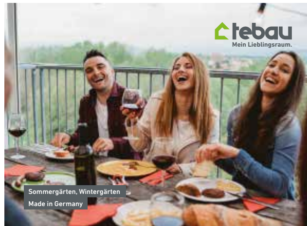
Tebau – Mein Lieblingsraum.