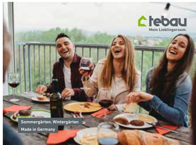
Tebau – Mein Lieblingsraum.