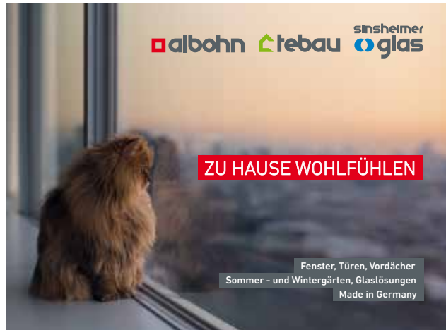
Unternehmensgruppe Alfred Bohn – Zu Hause wohlfühlen