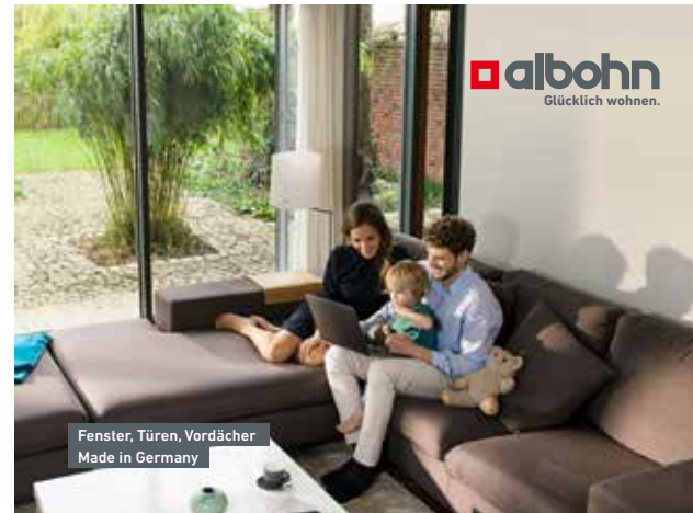
Albohn – Glücklich wohnen.